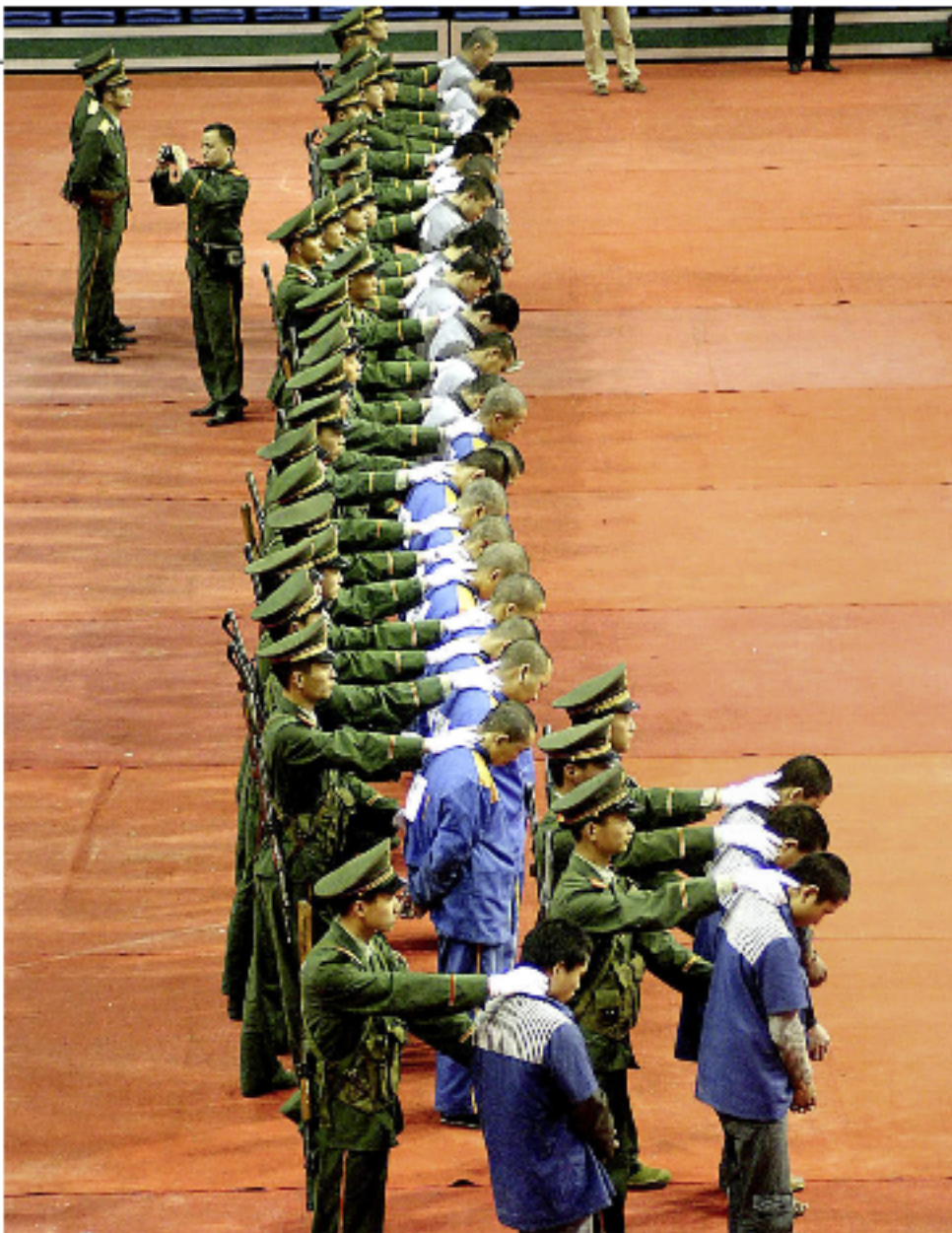
Zurschaustellung Strafgefangener in Ostchina 2004: Auf Bestellung hingerrichtet?

sen Tagen der Welt präsentiert: Umerziehungslager gehörten abgeschafft, die Ein-Kind-Politik gelockert, den Bauern sollten mehr Rechte eingeräumt werden.